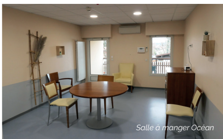
Salle à manger Océan