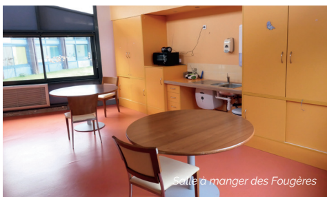
Salle à manger des Fougères

Les menus sont validés en collaboration avec la diététicienne lors des commissions restauration.