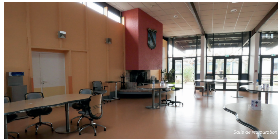
Salle de restauration