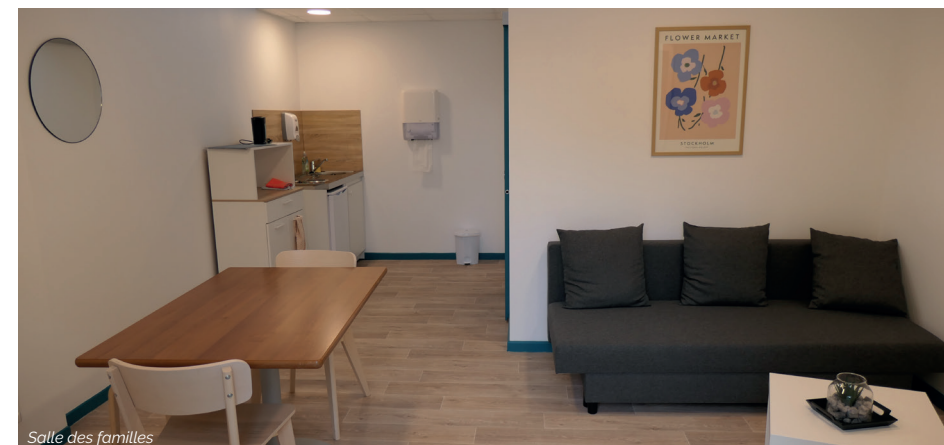
Salle des familles

Fête de Noël : Les fêtes de fin d'année sont l'occasion de se réunir et de partager de bon moment de convivialité.