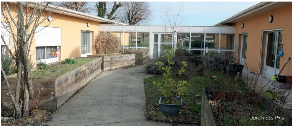
Jardin des Pins

L'unité des « Pins » accueille 17 personnes accompagnées (16 en accueil permanent et 1 en séjour temporaire) nécessitant un accompagnement plus important soit du fait de leur handicap soit du vieillissement.